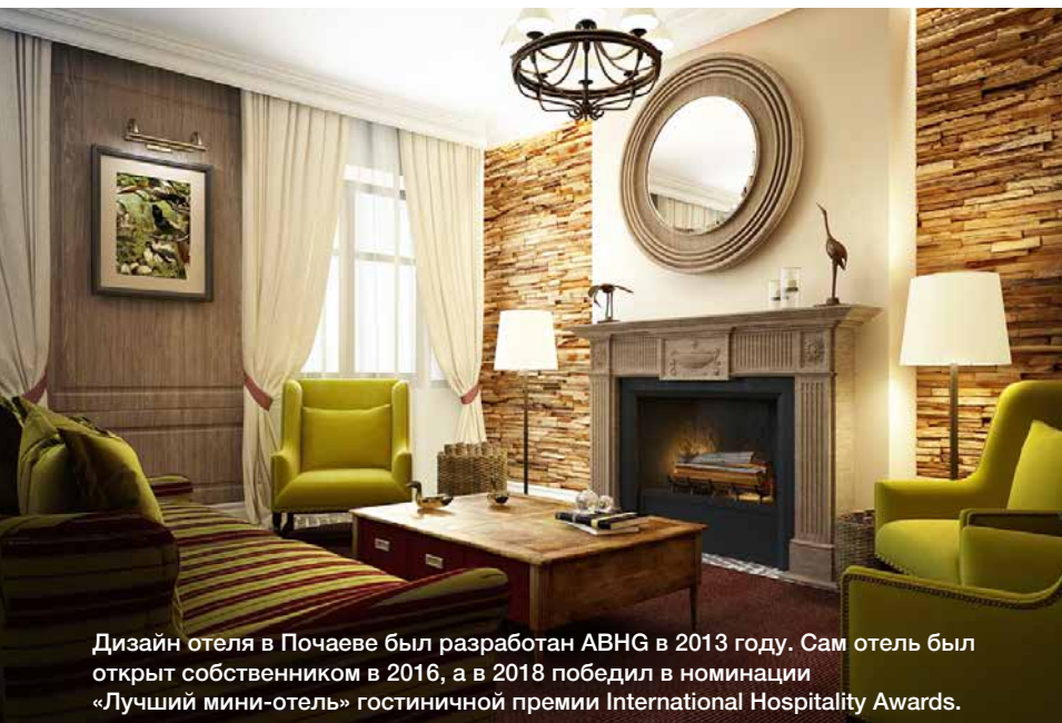
Дизайн отеля в Почаеве был разработан ABHG в 2013 году. Сам отель был открыт собственником в 2016, а в 2018 победил в номинации «Лучший мини-отель» гостиничной премии International Hospitality Awards.

В нашей компании мы исповедуем максимальную точность и аккуратность на начальных этапах проекта, в процессе планирования и расчетов. Именно поэтому мы делаем ФЭМ на основе тех эскизных планов, которые разрабатываем вместе с проектировщиком на предыдущем этапе. Чем точнее вы будете знать,