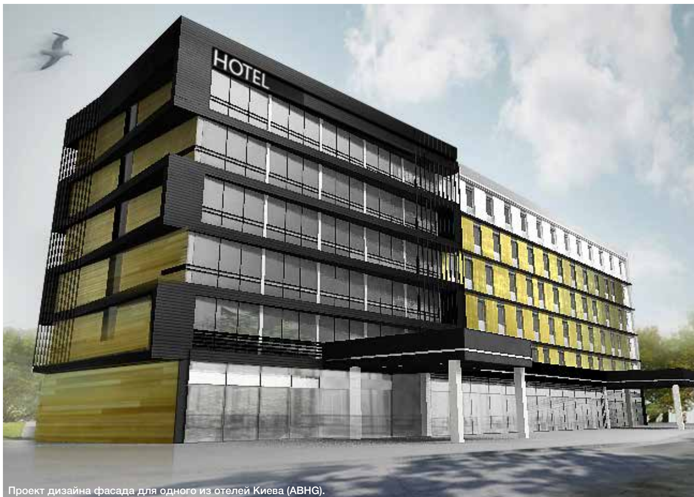
Проект дизайна фасада для одного из отелей Киева (ABHG).