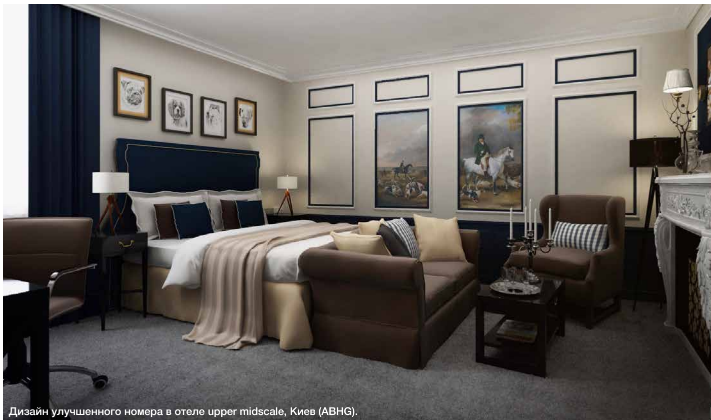
Дизайн улучшенного номера в отеле upper midscale, Киев (ABHG).

Проектирование и дизайн vs дизайн и проектирование. С чего начать?