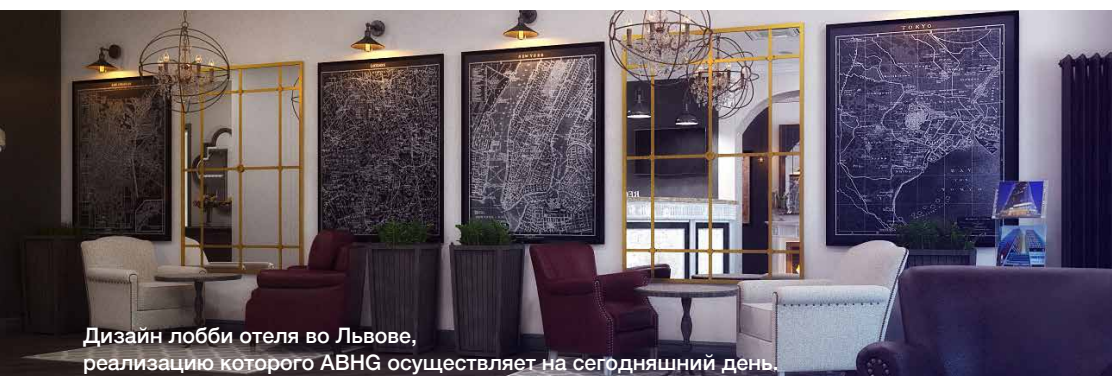
Дизайн лобби отеля во Львове, реализацию которого ABHG осуществляет на сегодняшний день.

Как правильно построить правильный отель? Если совсем коротко, то необходимо, чтобы КОМАНДА ПРОФЕССИОНАЛОВ ДВИГАЛАСЬ ПО ЧЕТКОМУ АЛГОРИТМУ.