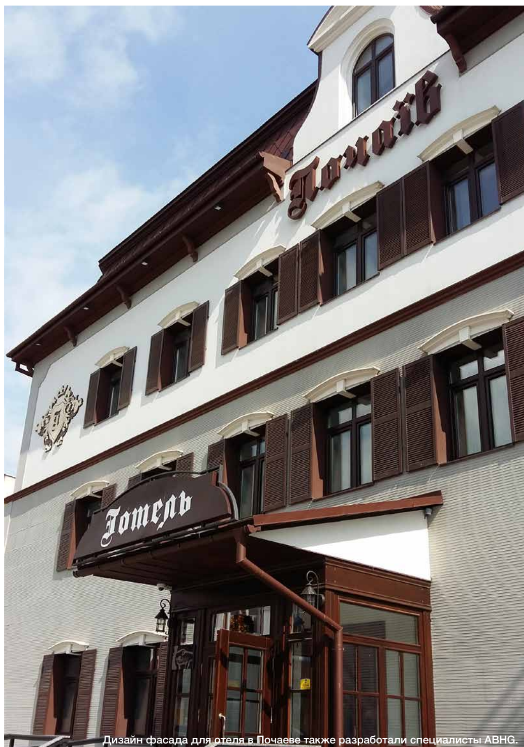
Дизайн фасада для отеля в Почаеве также разработали специалисты ABHG.

Костяк персонала должен появиться в вашем отеле еще до того, как закончатся все строительные работы. Особенно это касается инженерных подразделений отеля, о которых очень часто забывают и предпочитают набирать чуть ли не в последнюю очередь.