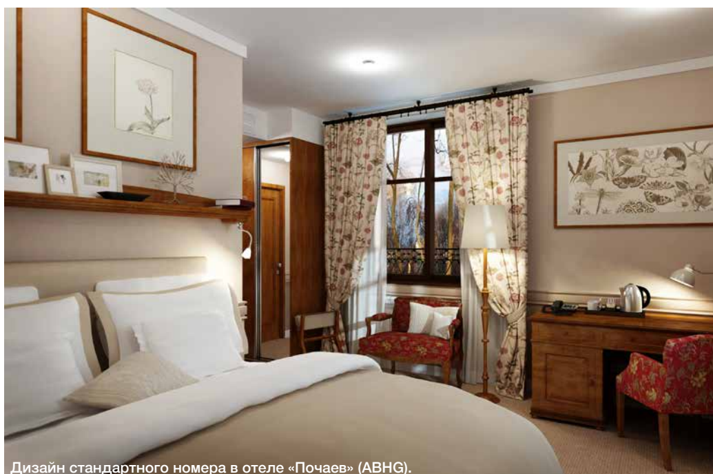
Дизайн стандартного номера в отеле «Почаев» (ABHG).

На объект все должно прибывать вовремя. При этом очень желательно, чтобы ценный денежный ресурс распределялся грамотно и по мере необходимости, избегая той ситуации, когда все будет закуплено сразу и месяцами отлеживаться на складе, ожидая своего часа.